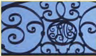
Ce sont les initiales des trois personnes qui ont installé l'usine dans ce château à partir de 1856.

Continue la rue qui porte leur nom et tourne à gauche rue du château. Aperçois-tu ce château ? Il est ensuite devenu une fabrique de limes au 19eme siècle ! Il n'en reste aujourd'hui qu'un joli portail en fer forgé avec un médaillon au centre où tu devines 3 initiales.