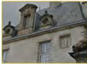
Ces religieuses s'occupaient de l'éducation des jeunes filles.

Un autre couvent de femmes existait vers le grand tilleul à la même époque. Tu remarqueras une jolie façade (photo) : c'est une partie de leur couvent (17eme siècle). Pour trouver leur nom, trouve le nom de la rue !