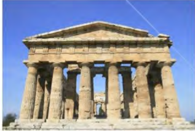
un temple grec ?