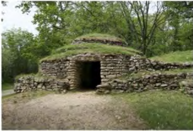
un tumulus ?

D'après toi, de quoi s'est inspiré l'architecte (qui s'appelait Caristie) qui l'a dessinée ?