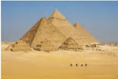
une pyramide ?