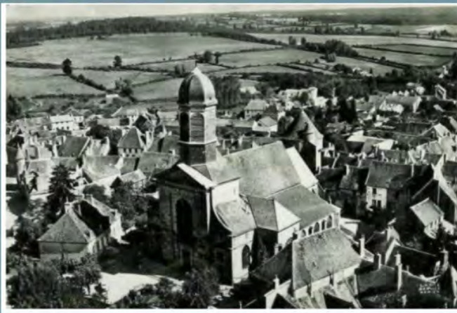
L'église d'Arnay entourée de l'ancien rempart et de la tour, derrière.

La façade, le clocher et le plafond que tu verras à l'intérieur sont les plus récents : ils datent de 1749 et 1859. L'église a été aussi récemment restaurée.