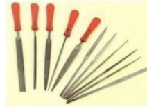
Photo d'un tailleur de limes à Arnay-le-Duc

De 1865 à 1954, le château fut occupé par une fabrique de limes . On fabriquait ici des limes de 3 à 60 cm pour les bijoutiers, les graveurs, les sculpteurs, les horlogers, et aussi les dentistes. Elles étaient taillées à la main. Près de 400 ouvriers travaillaient ici